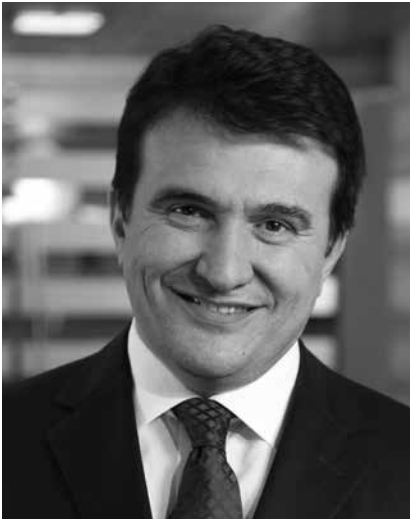
Hulusi Belgü AYD Başkanı